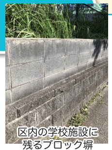
区内の学校施設に残るブロック塀

市内の小中学校に残るブロック塀は定期的に点検を実施しており直ちに安全上の支障はありませんが、更なる安全の確保を図る必要があると考えています。残る48校のブロック塀を、7年程度で全て撤去するよう着実に取り組みます。