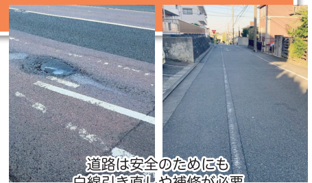
道路は安全のためにも白線引き直しや補修が必要

向こう45年間の公共建築物とインフラ施設の保全更新コストは約7.7兆円です。リノベーション手法等による長寿命化の徹底やコスト抑制を図り、保全更新の進め方においてより一層の工夫に努めます。