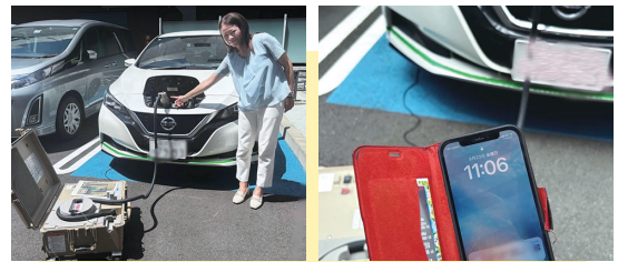
ポータブルバッテリーでスマホを充電！