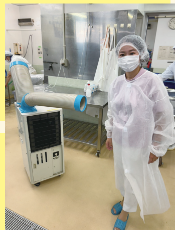
小学校の給食調理室を視察 （すごく暑かったです）