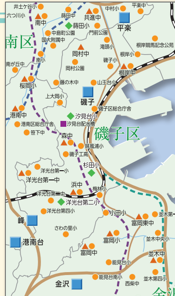
(磯子区及び周辺の災害時給水マップ)