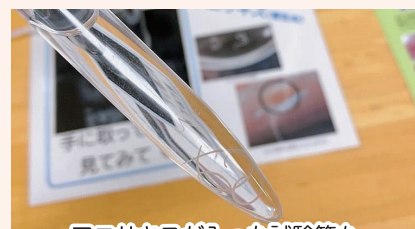
アニサキスが入った試験管も