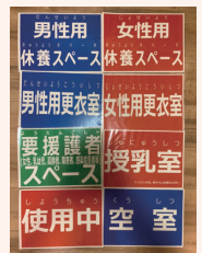
「各地域防災拠点に配布されているカード」

しかし、運営委員の中に女性がない場合があったりと、まだまだ女性の視点を入れる課題は解消されていません。私は、引き続き女性や子ども、介護が必要な方等、様々な立場の方の視点を取り入れた避難所運営がなされるよう取組んでまいります。